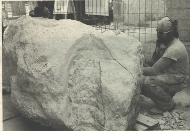
Letztes Jahr Stein, dieses Jahr wieder Holz

Nachdem in den beiden letzten Jahren in Stein gearbeitet wurde, davor in Sand, kehrt man nun zu den Wurzeln zurück. Wie bei der ersten Ausgabe, werden 2007 wieder Skulpturen aus Holz geschaffen. Die Eichen-Baumstämme von bis zu zwei Metern Länge und 80 cm Durchmesser liegen bereit, die sechs Künstler treffen am Montag ein. Bearbeitet wird