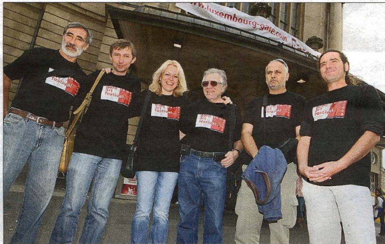
Concentration mais aussi introspection: c'est un défi à relever pour ces six artistes puisqu'il n'est pas toujours évident de créer hors des murs de son atelier

Créé en 2001, le festival a pour but de mettre en valeur le quartier à travers une animation culturelle de qualité. Cet événement contribue aussi à faire connaître le potentiel luxembourgeois au sein de la communauté artistique internationale.