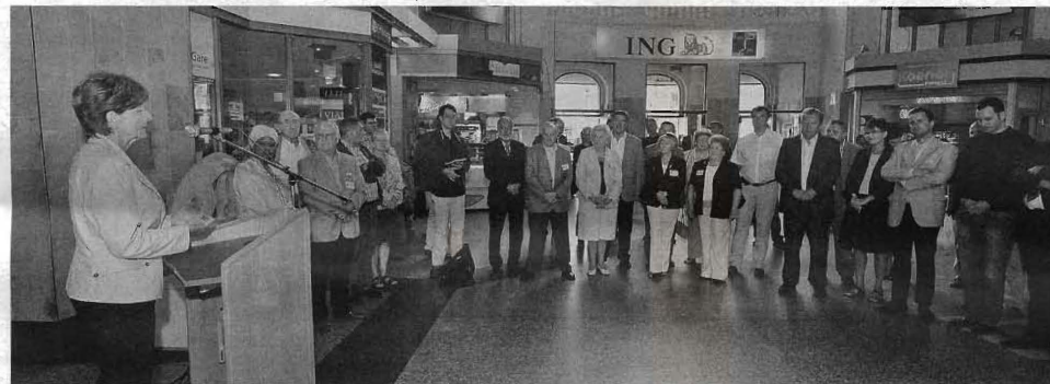
Stadtschöfün Anne Brasseur bei der offiziellen Eröffnung des „Gare Art Festival“ 2009

Übrigens, die diese Woche im Rahmen des „Gare Art Festival“ angefertigten Aluminium-Skulpturen sind zum Verkauf bestimmt. Etwaige Interessenten sollen sich vor-Ort informieren.