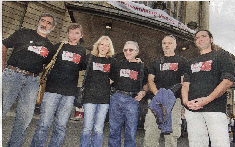
Die sechs Künstler, die an der diesjährigen Auflage des Gare-Art-Festivals teilnehmen.

Dabei erhalten einheimische Künstler die Möglichkeit, zum einen ihre künstlerische Entfaltung und Identität ihren Mitbürgern zu vermitteln, zum anderen im Kontakt mit bekannten Bildhauern aus dem Ausland Erfahrungen zu sammeln.